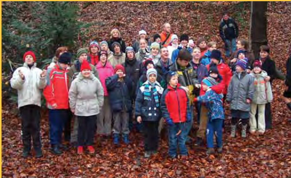
Ve Stromovce – Vánoce 2006

Co by mělo zaznít v úvodu tohoto sborníku - představení, vzpomínání, shrnutí, poděkování, nové vize..?