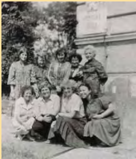
1. pedagogický sbor 1982

Teď po letech se probírám školní kronikou a vzpomínám na mnoho dětí, jejich humor, osobitost, schopnost být druhému kamarádem, je-