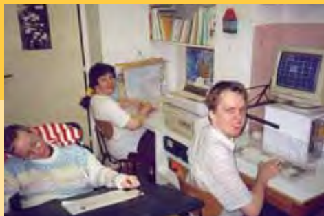
Ve dne třída, v noci ložnice

Většina žáků z Domova se začala učit v pozdějším věku, než je obvyklé (v deseti až v sedmnácti letech). Práce ve třídě byla velmi různorodá. V jedné skupině se žáci učili podle osnov počátečních ročníků Pomocné školy. Ve druhé skupině jsem měla několik žáků, kteří zvládali trivium, a jedna žákyňe dokonce potřebo-