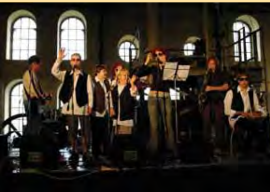
Vystoupení kapely Balónky v čističce