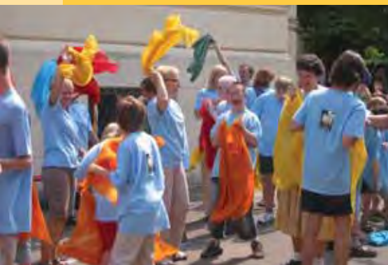
Na Zahradní slavnosti 2007