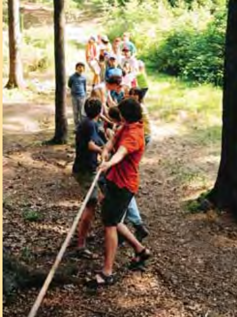
Všichni za jeden provaz

Od roku 1994 pořádá naše škola každoročně v srpnu letní integrované tábory. Letos tedy se tábor uskutečnil již poctřinácté.