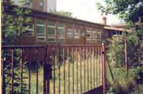
Pavilon SPC ve Vokovicích

ci se Domov rozšíří a třída se přesune do jeho bezbariérové části. Otevření domu v Liboci se však kvůli nedostatku prostředků odkládalo.