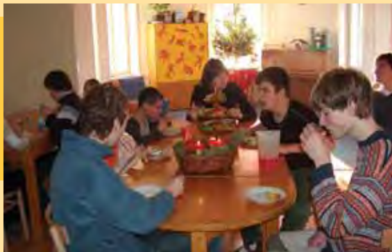
Slavnosť v jedálni