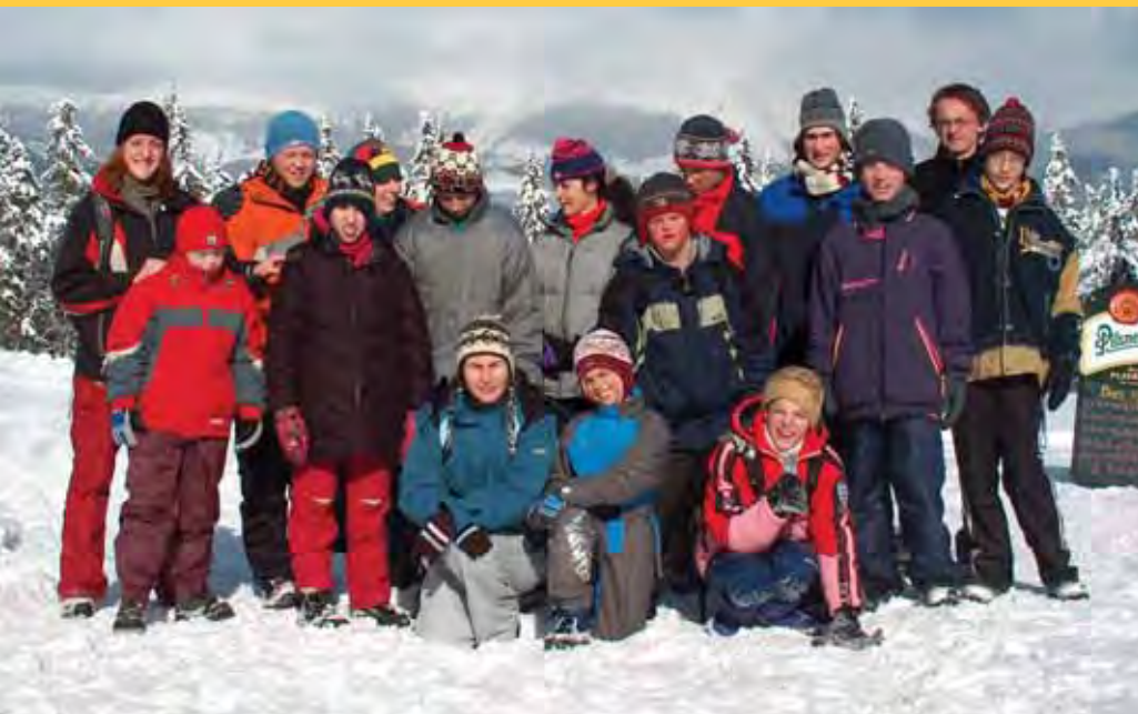
Škola na horách