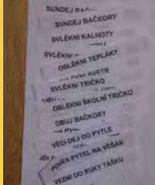
Ukázka práce s kartami