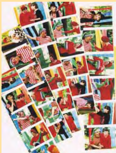
Plakát na hru Oživlé hračky

Vždy jde přitom o společnou tvůrčí činnost, vymyšlení drobnosti i celků, způsobu nacvičování. Vždy je to období hledání a objevování, zkoumání a zkoušení všech možností zvoleného námětu, období, které přitahuje pozornost malých i velkých herců. Dlouhodobá tvůrčí práce na inscenaci dává prostor k nalezení vlastní poetiky, k různým způsobům vyjádření, k zážitku společně něco dokázat a mít z toho radost.