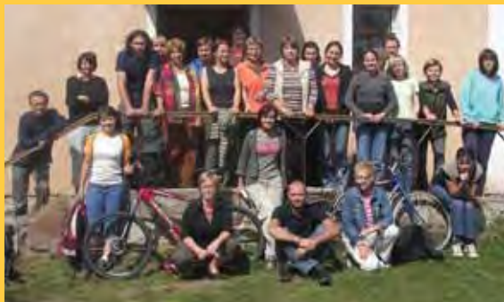
Zaměstnanci školy na výjezdní poradě ve Strašičicích – srpen 2007