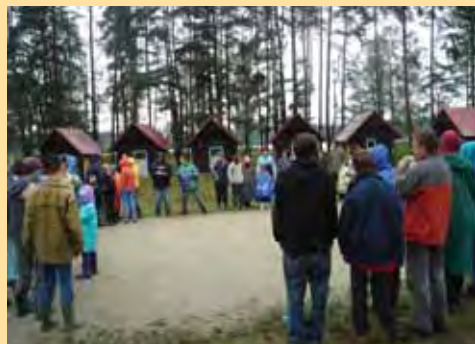
Táborníci na Bukové

Hlavní náplní tábora bývá vždy táborová hra, která tvoří základ denních programů během celé doby tábora. Za dětmi přicházejí pohádkové postavy, Pán lesů, Bílá paní, indiánský náčelník, skřítkové a loupežníci. Děti jim buď pomáhají, plní různé úkoly nebo nad nimi musí zvítězit. Dobro nakonec vždycky vyhraje a hra bývá zakončena objevením sladkého pokladu.