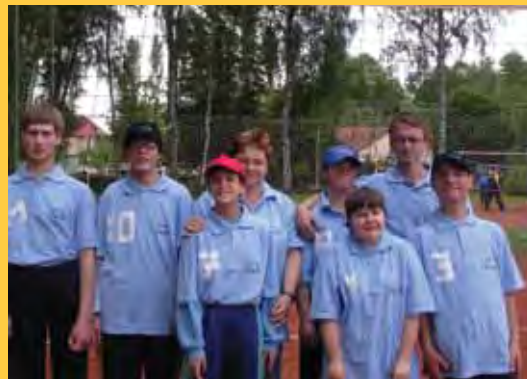
Turnaj v přehazované - Dřevěnice 2005