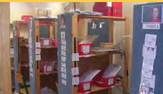
Struktura ve třídě pro žáky s autismem