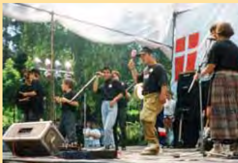
Vystoupení kapely Hudební dílny na festivalu na Plumlovské přehradě

V roce 2001 jsem nastoupil do Rooseveltky jako civilkář a co se nestalo, seznámil jsem se s vychovatelem Oldou. A tenhle Olda, studnice nápadů dalo by se říct, mimo jiné ve sklepních prostorách školy přestavěl jednu místnost na zkušebnu. To mě tak uchvátilo, že jsem na Oldu naléhal, ať mě tam bere častěji a častěji v rámci odpolední aktivity družiny s názvem Kapela (Hudební kůlna). Děti sem chodily hrát na opravdové nástroje a zpívat na mikrofony. To bylo něco. Ač jsem do té doby neměl zkušenost s lidmi s postižením, bylo mi jasné, že to je to pravé. Ano, ano zapřemýšlejte, v hloubi duše každého z nás se ozývá tu malý, tu velký hlas, který říká: „Chci stát na pódiu a vidět, jak lidi zpívají a tančí na (mou) hudbu, chci být Karel Gott.“ Po šesti letech práce ve speciální škole vím, že ten hlas je u dětí obrovský a touha se ukázat jakbysmet. Rok poté Olda odešel, a zůstala výzva zkusit pokračovat v dobré věci, kterou Olda začal.