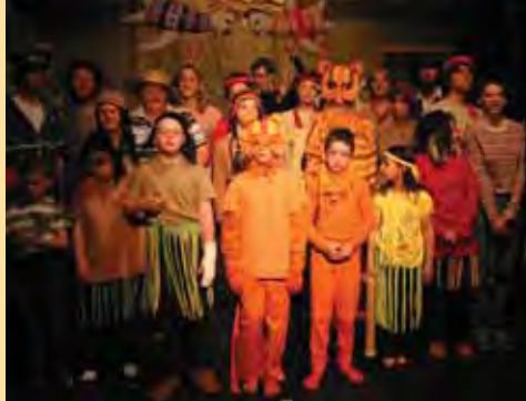
O smutném tygroví