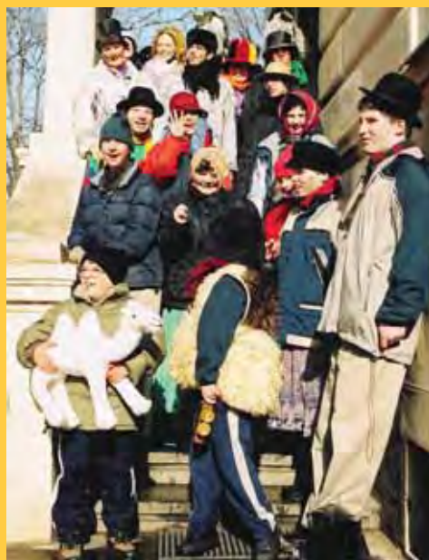
Masopust průvod vychází ze školy