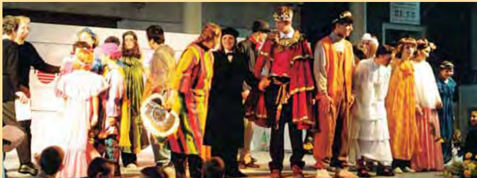
Hra o malém princí