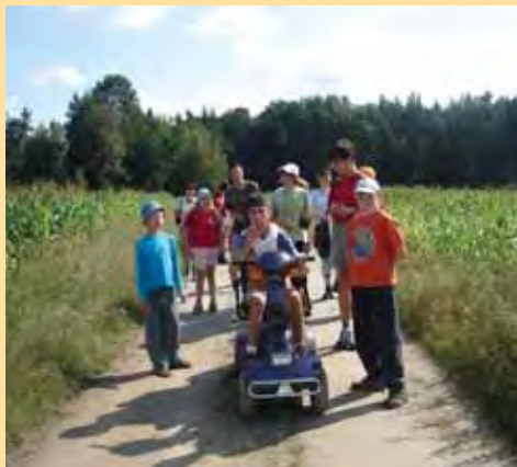
Na cestě z Bukové

„Lépe zapálit jednu svíčku, než si stěžovat na tmou“