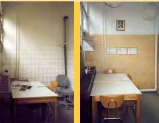
Dříve umývárna - pak třída

Během prázdnin se mi podařilo z původně neútulného prostředí, plného bílých kachlíčků a vypadávajících oprýskaných oken, vytvořit docela příjemnou místnost.