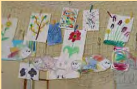
Výtvarné práce žáků

Keramická dílna je během roku pravidelně propůjčována žákům ze ZŠ Emy Destinové v rámci programu skupinové integrace. Pro členy SPMP je organizováno 2x ročně výtvarné odpoledne v keramické i výtvarné dílně.