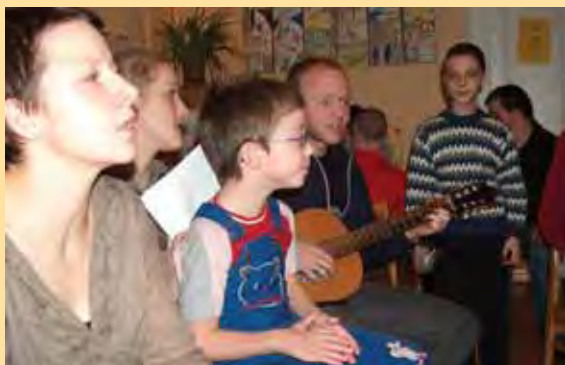
Zpívání v jedně