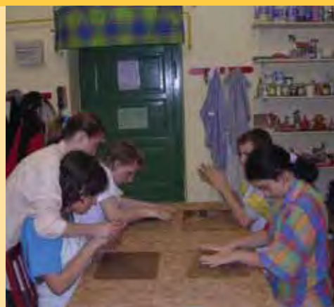
Práce v keramické dílně

V oblasti výtvarné a rukodělné výchovy se žáci učí rozlišovat a používat barvy, pracují s různými typy materiálů, které podporují jemnou motoriku a psychomotorický rozvoj. Výtvarné a pra-