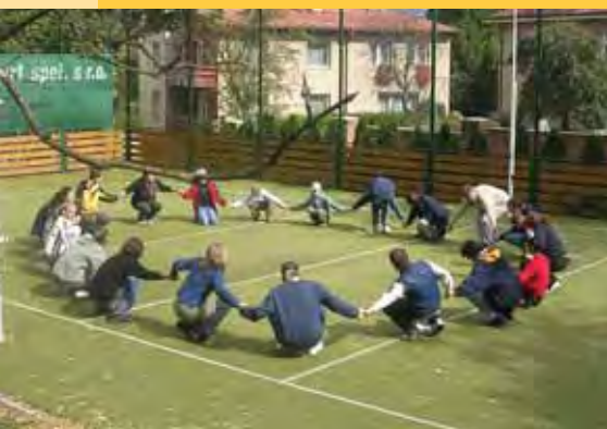
cvičení na školním hřišti