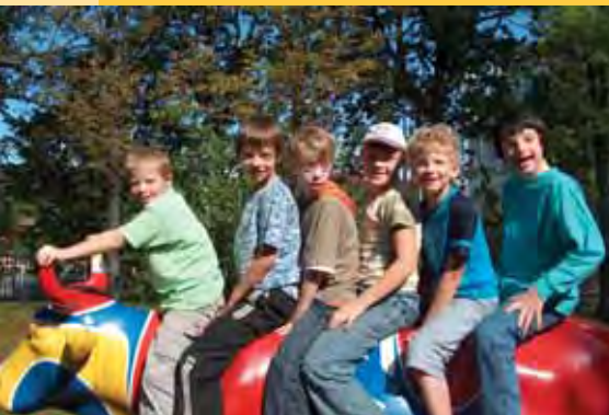
Kluci ze třídy "E" na krávně