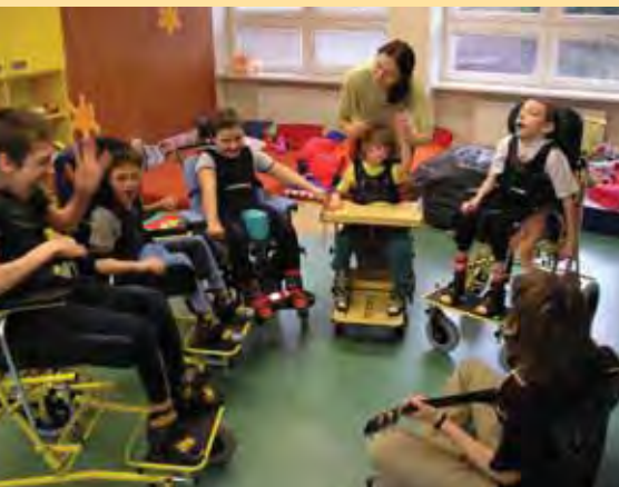
Žáci v rehabilitační třídě

Pracovní stůl (jasně ohraničené místo), používá se systém zleva doprava a shora dolů (v levé části jsou zadané úkoly), strukturované krabicové úkoly (krabice vnitřně strukturované na několik