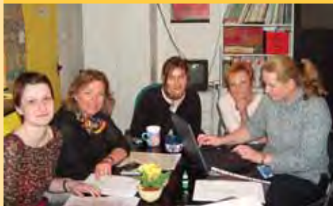
Pracovnice SPC Vertikála

SPC Vertikála vzniklo při škole v roce 1994. Prostory získalo v suterénu školy, k dispozici mělo z počátku 1 místnost. V počátcích fungování SPC se pracovalo pod vedením Pavly Baxové především na realizaci experimentu MŠMT – integrace dětí se speciálními vzdělávacími potřebami do běžných základních škol. S přibývajícím počtem takto integrovaných žáků bylo zapotřebí personálního posílení centra o další pedagogické pracovníky.