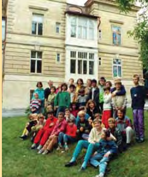
Škola v roce 1993