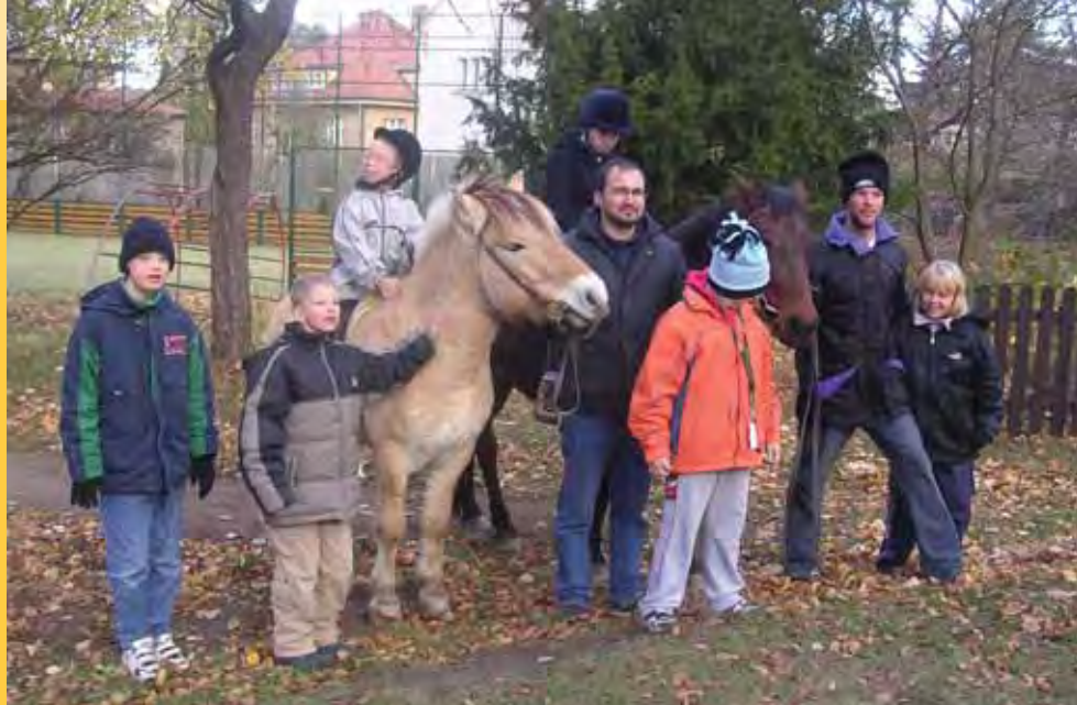
Hipoterapie na zahradě školy