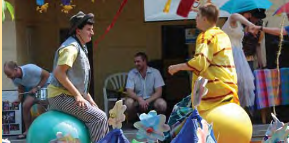
Zahradní slavnost 2006