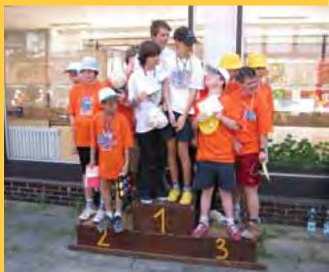
Ze sportovních her