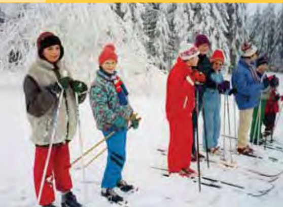
Zimní pobyt na Hájence