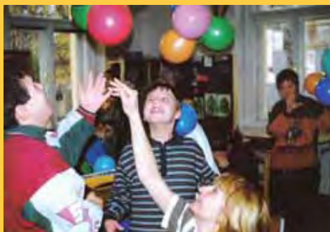
Ve třídě „A“

Když jsme se (několik spolužaček z Pedagogické fakulty) po ukončení studií loučily s myšlenkou, že bychom v budoucnu rády učily v jedné škole a tu bychom si utvořily podle svých představ, netušily jsme, jak se sny mohou plnit. Školu v krásném místě první našla jedna z nás a později tu zakotvilo všech 6 ostatních spolužaček. Já jsem začala učit - tehdy ještě v pomocné škole - v roce 1990. Vzpomínám na den, kdy jsem poprvé vkroči-