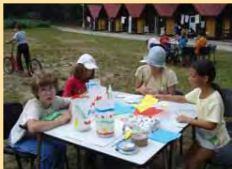
Arteterapie na táboře