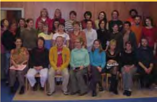
Zaměstnanci školy na pedagogické radě – duben 2007